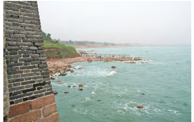
老龍頭先端から眺める渤海湾の景色は絶景です

かつて日本の租借地であった関東州や、当時そこに駐留した、旧日本軍の最強部隊といわれた関東軍の名称もこれに由来のものです。