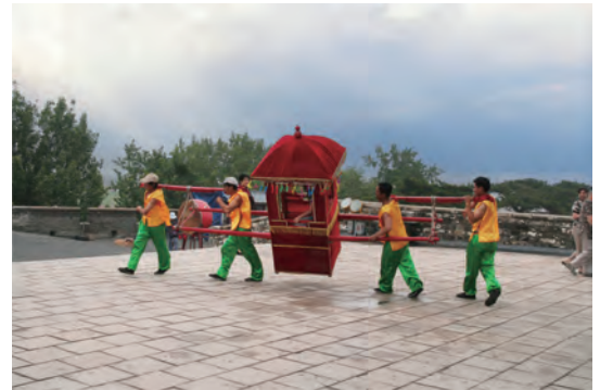
これは結構式に向かう花嫁のかご、もちろ ん、観光客向けデモンストレーションです