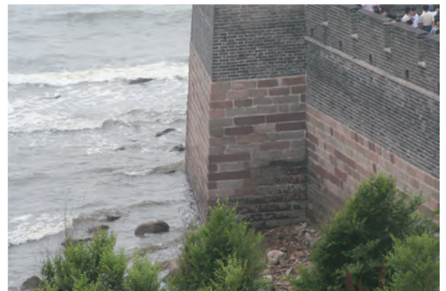
先端の起点左部分、ここから総延長21,296.18kmあります

旅行するには日 本円でおおよ 1500万円 ぐらいの保 証金を積ま ないと行け ない、保証 金は帰国す ると返し てくれる