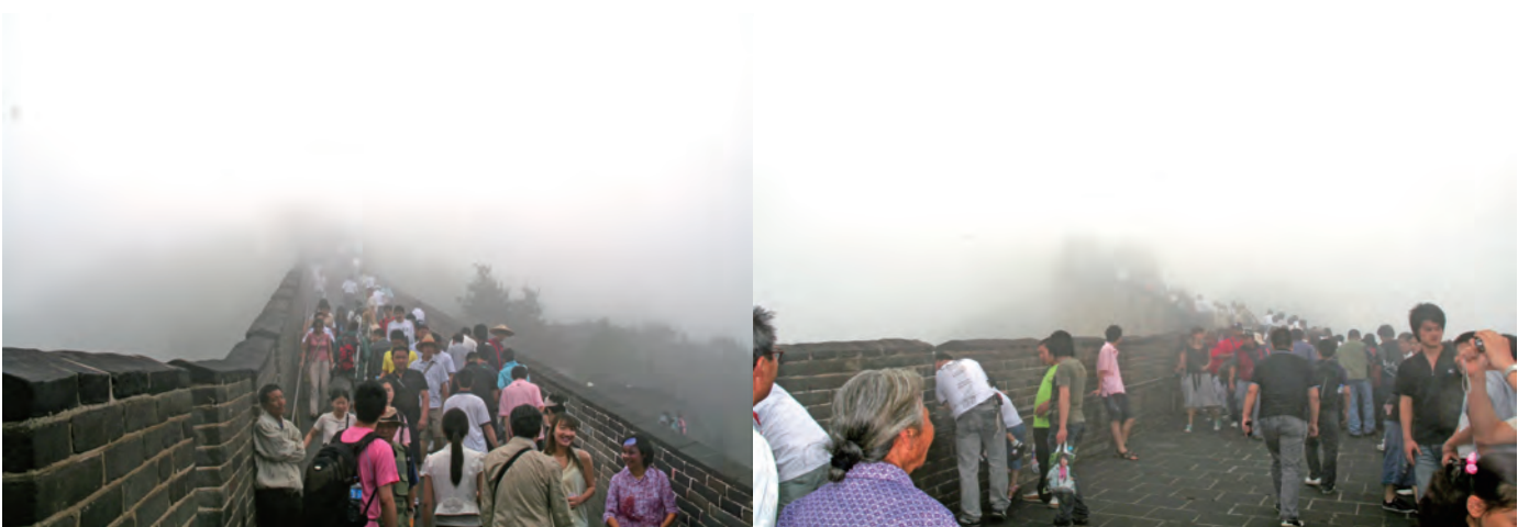
あいにくの天候にもかかわらず、さすがにこの人気です、何も見えません、翌年もう一度訪れようと決意を決めた写真です

そのため掲載している万里の長城、八達嶺の写真は、翌年のリベンジ写真がほとんどです。今回の悪天候写真も最後に少し掲載しておきますが、何も見えない、見えないあたりが八達嶺の写真です。リベンジで翌年訪れた天下の名勝八達嶺はさすがに立派でした、すごいです。確か65歳以上高齢者向け半額引きで入場できました・・・なぜかという年齢を重ねると体力的に長城の半分ぐらいしか登り切れない人が多いためとの配慮だそうです。このとき若干名だけ65歳を超えていましたが、仲間5人全員が急遽65歳以上に変わり、身分証のパスポート見せろとも言われましたがホテルに置いてあるなどと返答、臨機応変でこのとき二人だけ65歳を超えていた全員半額で全員長城最終地点まで登り切ってきました。