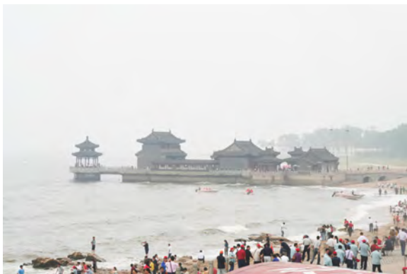
この日は少々海が荒れ模様でしたが、それでも渤 海湾城壁左前方に見える観光スポットは絶景です

そうですが、海外旅行と称して国外脱出を兼ねて、 帰ってこないケースを想定して、中国国内に相当 な資産を有する階級しか海外旅行を認めていなかった時代です。観光ガイドですら、日本語は話 せるが日本には行ったこともない、彼らにとって訪れてみたい国として羨望の的としてとらえて いました。ちなみに当時大卒の給与で3~5万（日本円）レストランのウエイトレスで5000円 ぐらいと記憶しています。その頃の1500万円の保証金を出せるのは相当な金持ちクラスだった と思います。