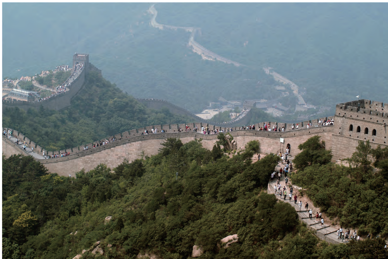
晴れた日の北京市郊外に連なる万里の長城八達嶺、天下の絶景です（絵になる写真は翌年訪問時の写真です）