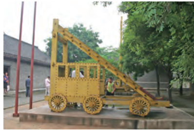
城壁を守る兵器のようです、当然 展示用の復元模型だと思います