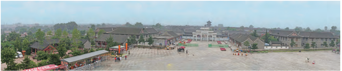
城壁の内側のパノラマ風景、当時の貴重な家並み保存、再現した家屋が展示されていました