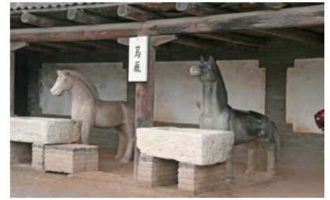
この頃丁度北京郊外に開園した動物園の 展示用のシマウマが入手困難で馬に白ペ ンキで塗って檻に入れられていたとニュ ースで報じられ、世界からブーイングを 浴びていましたが、石で出来た展示用の 馬があまりにお粗末で貧弱です。