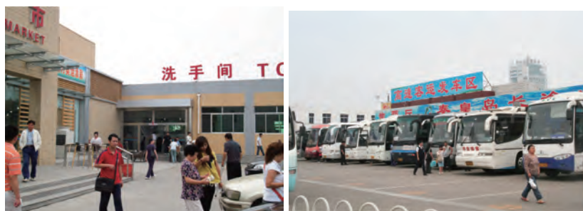
帰りのバスターミナルの問題のトイレ（洗手间シーショージェンといいます）

つれのひとりがバスの待合室ターミナルで用を足しに行った時の話です。「とてもよーせんわ！」といって中断してあきらめて帰ってきたいきさつがあります。聞くとかなり酷いというか中国おなじみの地元密着型「ニーハオトイレ」よりもっと酷いものだったらしいです。一応水洗らしかったですが、流れてもいなく、汚物がてんこ盛りに盛り上がり、ニーハオどころかさすがに叫び声すらでませんでした。あきらめて北京まで我慢すると言って帰ってきました。また、屋に入った高級レストランの来客専用のトイレも写真の有様です。隅にあるバケツは使用済みペーパー入れ、もちろん使用したペーパーは中国では流すことはタブーです。こればかりは男子用でしたが思わずシャッターを切ってしまいました。