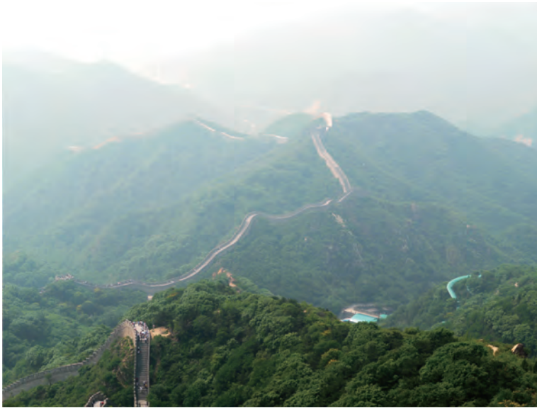
山並みに沿って延々と連なる万里の長城八達嶺、絵になっています

改めて解説することはありませんが、我々が学校で習った時代の頃から、最近になって分かってきたこともありますので、ついでに知っていただければと思います。八達嶺は北京から車で1