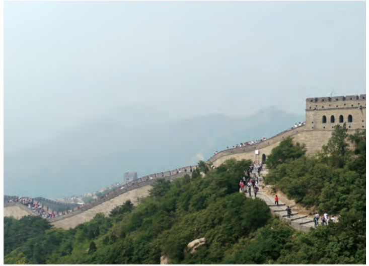
どこを撮っても絵になる光景です、この人の多さ

万里の長城といえばスペースシャトルから見える人工物の一つで、もう一つはおなじみエジプトのピラミッドということらしいですが、このことは中国の教科書に長い間掲載されてきたらしいですが、2003年に中国初の有人宇宙船に搭乗した宇宙飛行士の報告では万里の長城は見えなかったと証言したため、このことは教科書から削除されたそうです。中でも万里長城、八達嶺といえば中国でも超有名な観光地で、万里長城の観光ガイドには必ずといっていいほどこの風景が紹介されています。