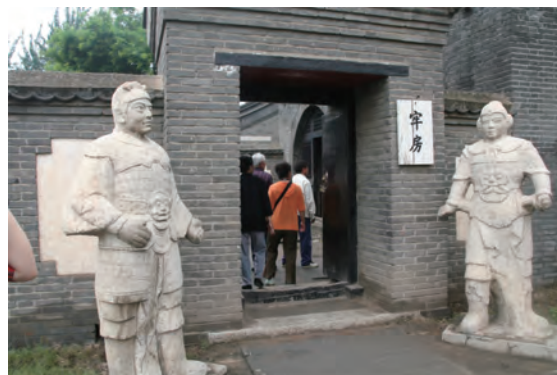
城壁の中は展示室や資料室になっています、これは牢屋のようです

従って案内中何度もここ山海関は中国国民にとって単なる観光地や、万里の長城の最先端ではなく、もっと重要な史跡でかつ、中国国民でないとその歴史、経緯がわからない歴史の重みを感じる、万里の長城最先端であるとの解説をガイドから説明を聞きました。