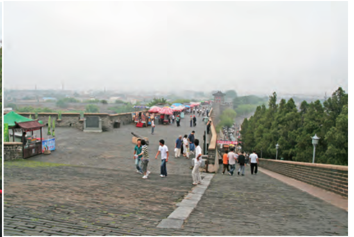
城壁の上はこんな風に散策できる広さようです、観光客相手に土産物屋や屋台の parasol も出ています

この天下第一関の老龍頭等の史跡は世界遺産にも登録されて間がない頃、ご存じの方もおられるかと思いますが、世界遺産の登録条件には水洗トイレ設置で清潔さが第一の必修条件だそうで、トイレが完備してない史跡は登録から除外されるらしく、遺跡内は完備していましたが一步外へ