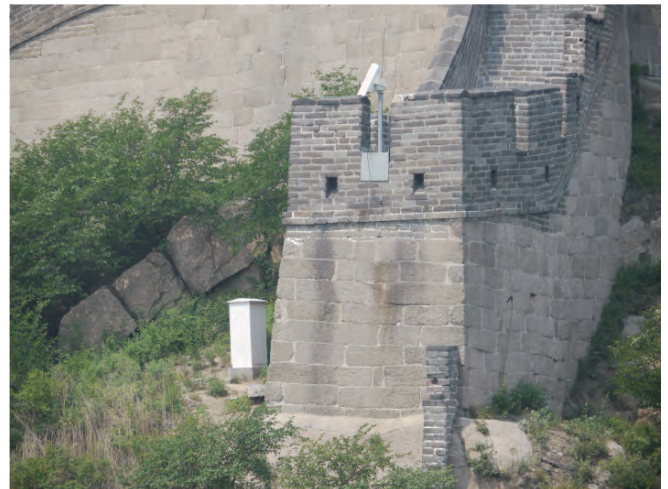
枝部分の端はこのようになっています、TVカメラが邪魔です

現地でガイドに構造的について聞いてみますと、専門用語で「版築」(ばんちく)と呼ばれる工法で、レンガなどで補強の壁をこしらえて、中は土を突き固めて壇を作る工法。長城もこの工法で、全部レンガ作りではなく、壁の外側何列かと上部はレンガを積んでモルタルで固めてあり、中身全体は土を突き固めて張り子の虎構造になっているとのこと。もちろん全部がこの構造ではありません、いろいろ調べてみるとレンガの元となる陶土やそれを焼く石炭の入手困難な中国シルクロードの続く奥地西域になると、日干しレンガや砂土石の混じった礫を突き固めた痕跡が続いているそうです。