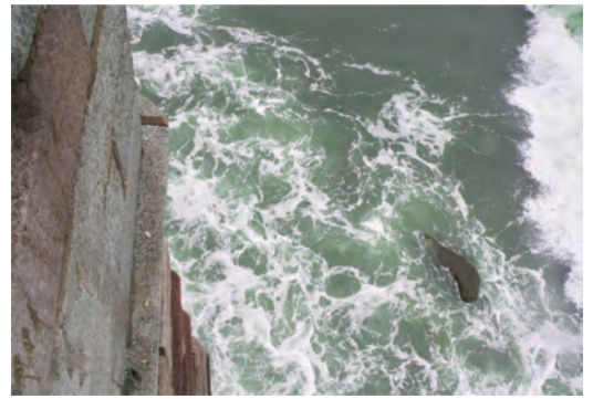
老龍頭先端の真下の海に突き出た部分の角部分

け渡し、次世代を清国に託した方がましだという考えの基、万里の長城を自らの民族の手で、一番初に開門したのがこの山海関の天下第一関であったわけです。従って国の存亡を掛けた決断を行ったのがこの「山海関の戦い」となのです。中国にとって日本の「天下分け目、の天王山」に匹敵する大きな歴史上の出来事だったわけです。中国国民、なかでも漢民族や満州族にとっては非常に意義深い、歴史上重要な拠点でもあり、いわゆる国が明国から清国に替わった、無血開城の史跡となったという、何か江戸城の勝海舟らの元での無血開城、明け渡しに近いイメージを想像ください。