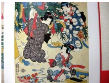
図-5 子供絵 江戸の子供たち くもん子ども研究所蔵

話は少し横道にそれるが、江戸錦絵の中で描かれた子供の晴れ着と、寝装具について触れておきたい。先に少し触れた江戸錦絵、俗に言う浮世絵は木版印刷の一種である。とはいえ、色数が多く、型合わせが正確で、紙に湿度をもたせ、入念に摺りを行うので、色が紙背にまで浸透し、異国の印刷に比べ、抜群の発色と落ち着きを醸し出す。江戸錦絵は江戸の最新情報を地方に伝える貴重な媒体で、旅人は必ず江戸錦絵を土産に持ち帰る。当時吉原のスター花魁が、どのような髪形や化粧をし、どのような文様の着物や帯を、どのように身につけたか、事細かに絵に描いて伝達した。他に対象になるのは市井の美女、歌舞伎、相撲、花鳥風月、暦、狂歌、東海道、富士観光等テーマは江戸を離れ、当時流行のツアーにまで及んだ。当時の子ども衣料については子供絵、寝装具の情報については春画でその詳細を知ることが出来る。