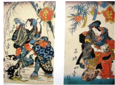
図-7 子供絵 江戸の子供たち くもん子ども研究所蔵

子供絵は、今まで研究者やマニアの間で殆ど話題にならなかったが、1985年鈴木重三が子供絵について「近世子供絵考序説」を発表して、江戸錦絵のジャンルの1つとしてその地位を確立した。