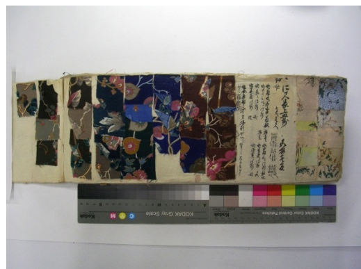
図一 4 阿蘭陀更紗 京都工芸繊維大学美術工 芸資料館蔵 AN-71

この時期捺染の先進国イギリスやフランスでは、高級捺染はインテリア関係のものが多かったが、日本では全く需要がなくむしろ衣料用のものが好まれ、それに相応しいものが運び込まれたのであろう。中にはマシーングランドの繊細な文様もあり、日本人には非常に珍しく、モダンな印象を与えたのかも知れない。素材は綿の金巾が多く薄手のローンや変わり織もある。