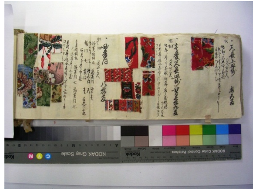
図一 2 阿蘭陀更紗 京都工芸繊維大学美術工芸 資料館蔵 AN-71