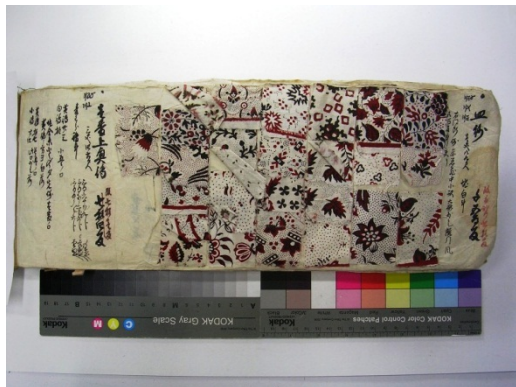
図一 3 阿蘭陀更紗 京都工芸繊維大学美術工芸 資料館蔵 AN-71