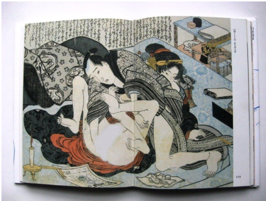
図-8 絵本 開中鏡

江戸錦絵のジャンルに春画がある。上質の物は誰でも名を聞けば知っている一流の絵師 の作品に多く、春信、清信、歌麿、北斎、豊国、国芳、英泉等が独自の画風で、春画の作 品を残している。寝室や小道具が細部に至るまで細かに描写されているが、ここでは蒲団、 夜着、寝巻、長襦袢に注目したい。