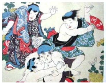
図-6 子供絵 江戸の子供たち くもん子ども研究所蔵